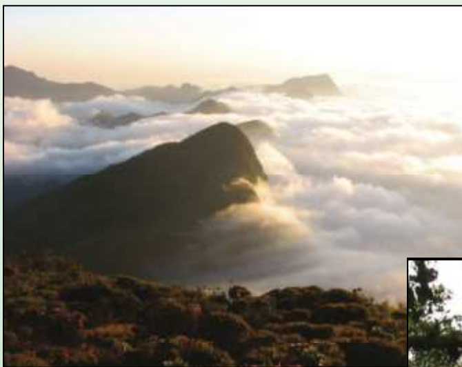
Pontões rochosos vistos a partir do Pico Soares, ponto culminante da Serra do Brigadeiro.