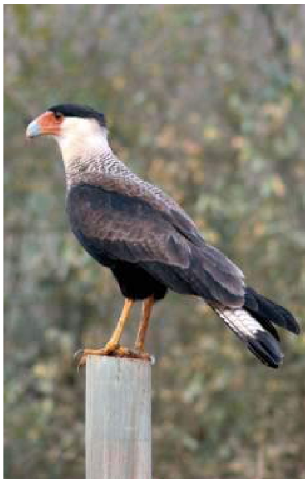
FIGURA 34: Caracará ( Caracara plancus )

A espécie no PERD: Falconiforme mais freqüente e abundante da região. Registrado em vários locais, desde a borda do parque até áreas mais preservadas, onde é observado em vôos cruzados. Registrado em todas as estações.