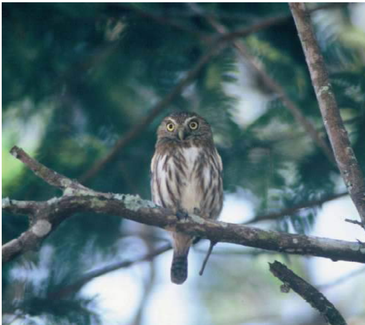
FIGURA 7: Caburé ( Glaucidium brasilianum )