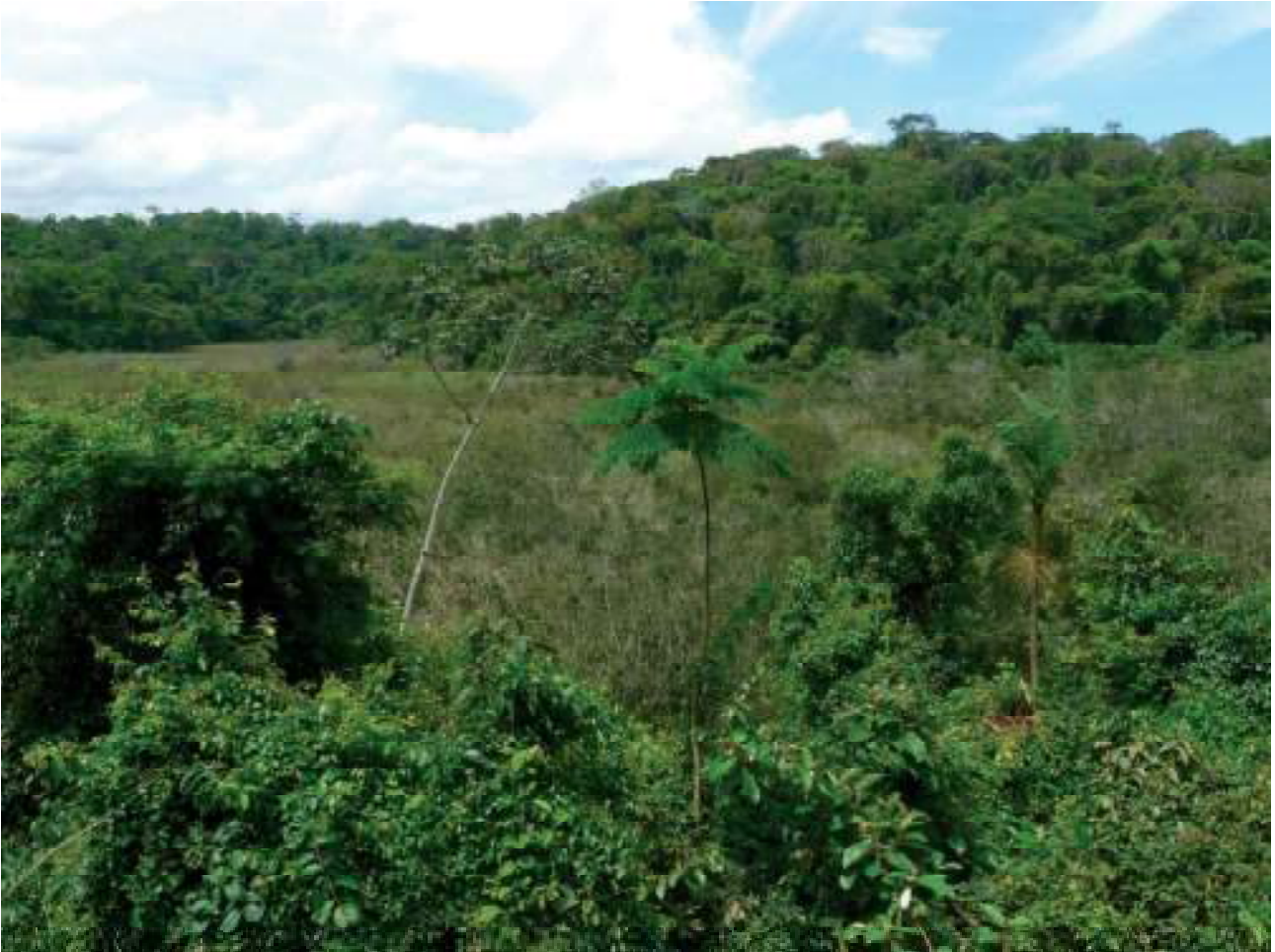
FIGURA 1: Vista do brejo e mata no interior da reserva