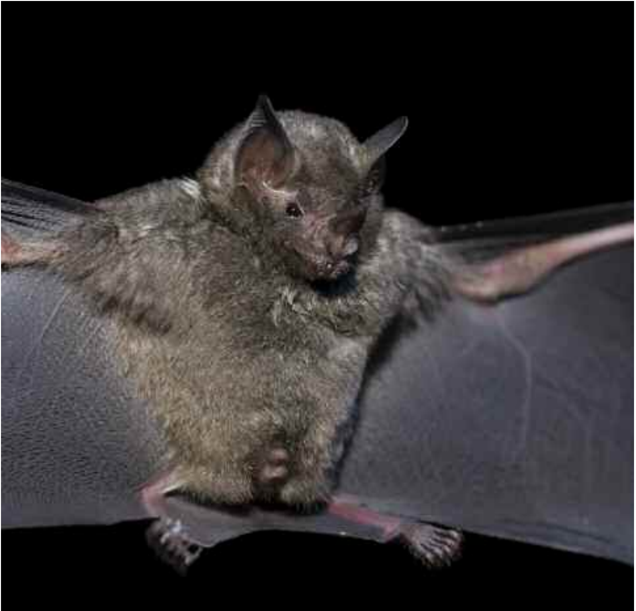
FIGURA 5 – Morcego frugívoro, Carollia perspicillata (Linnaeus, 1758).