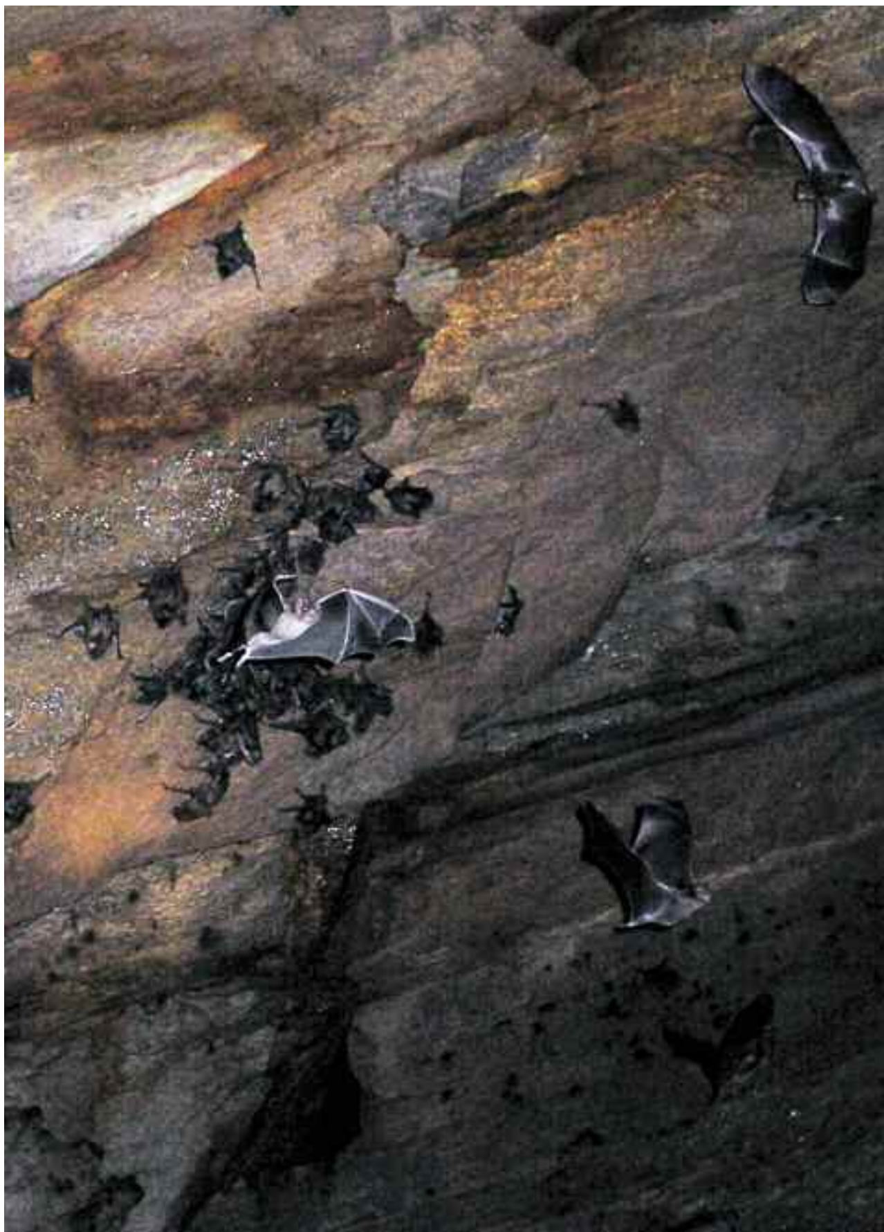
FIGURA 3 – Interior da Gruta das Bromélias, com destaque para uma “colônia” de morcegos hematófagos Desmodus rotundus .