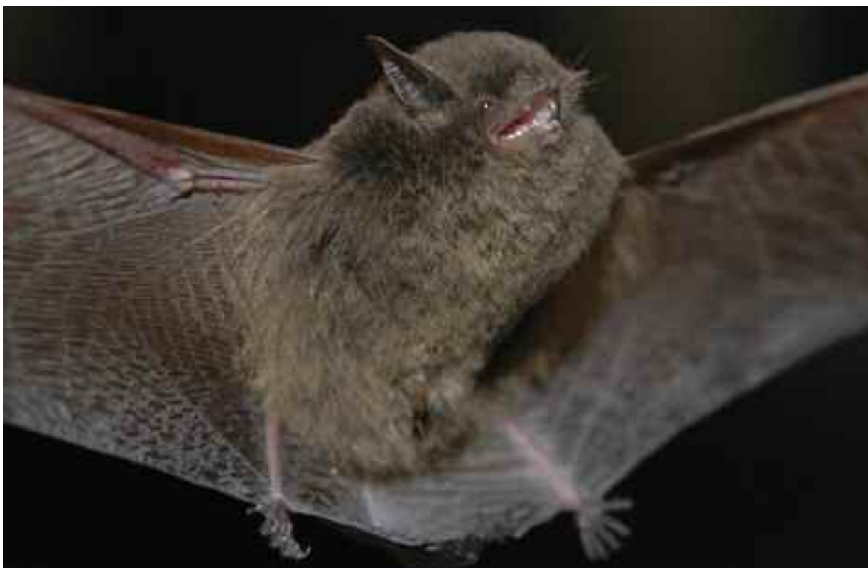
FIGURA 18 – Morcego insetívoro, Myotis nigricans (Schinz, 1821).