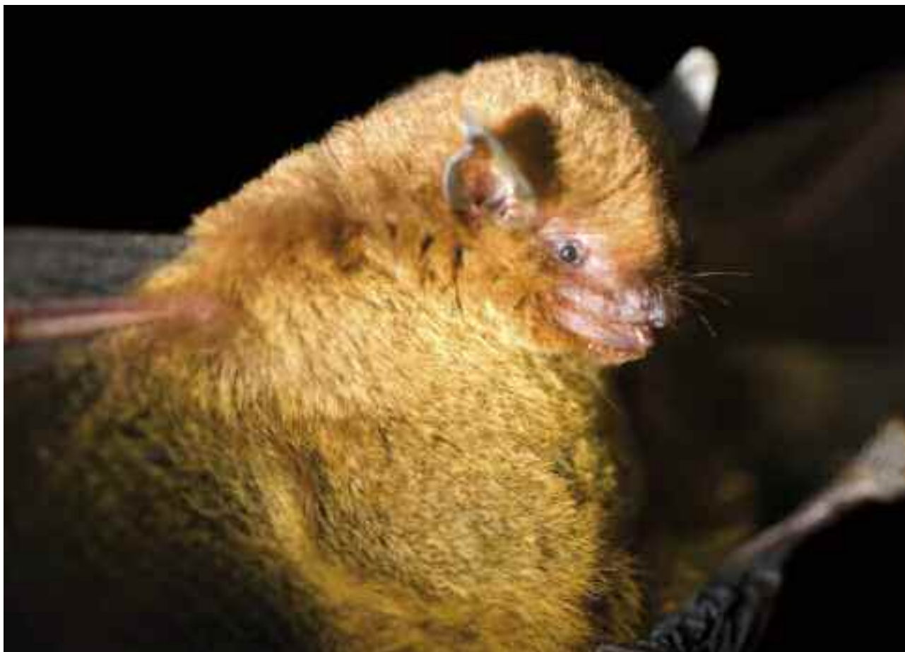
FIGURA 19 – Morcego insetívoro, Myotis ruber (E. Geoffroy 1806).