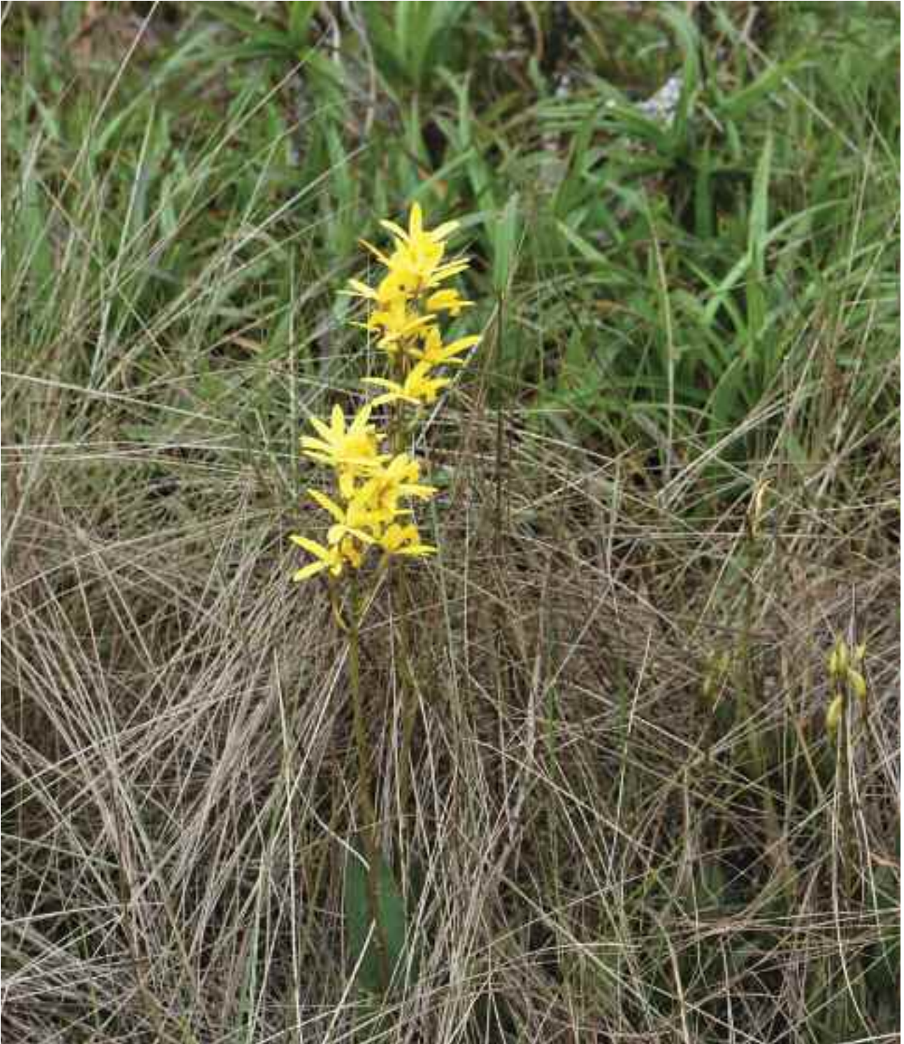
FIGURA 3 – Ambiente de ocorrência de Hoffmannseggella crispata entre gramíneas.