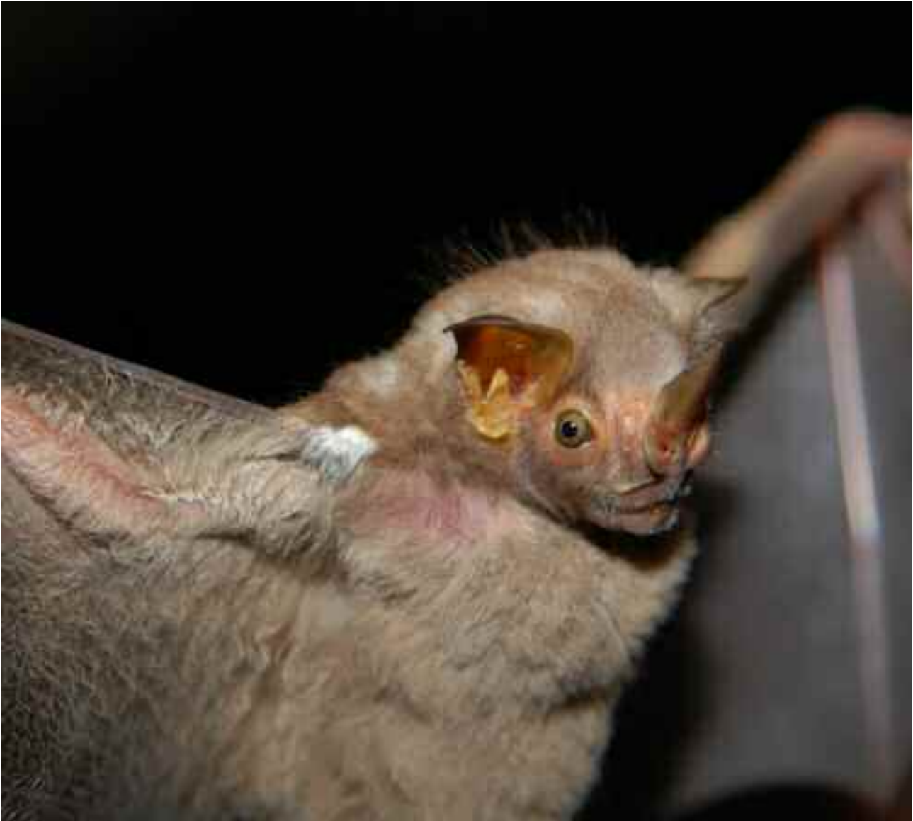
FIGURA 14 – Morcego frugívoro, Pygoderma bilabiatum (Wagner)