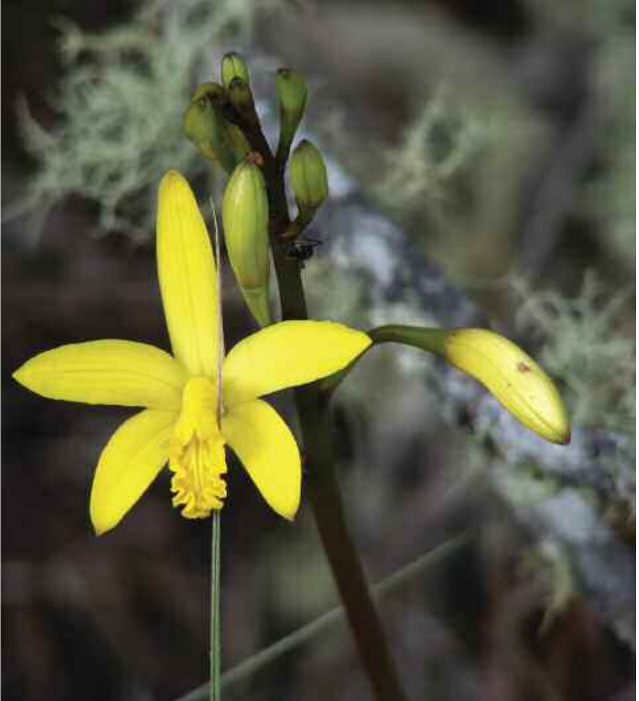
FIGURA 1 – Detalhe da flor de Hoffmannseggella crispata , destacando seu intenso colorido amarelo.