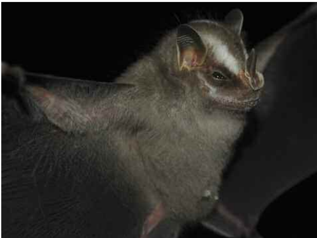
FIGURA 12 – Morcego frugívoro, Platyrrhinus lineatus (E. Geoffroy, 1810).