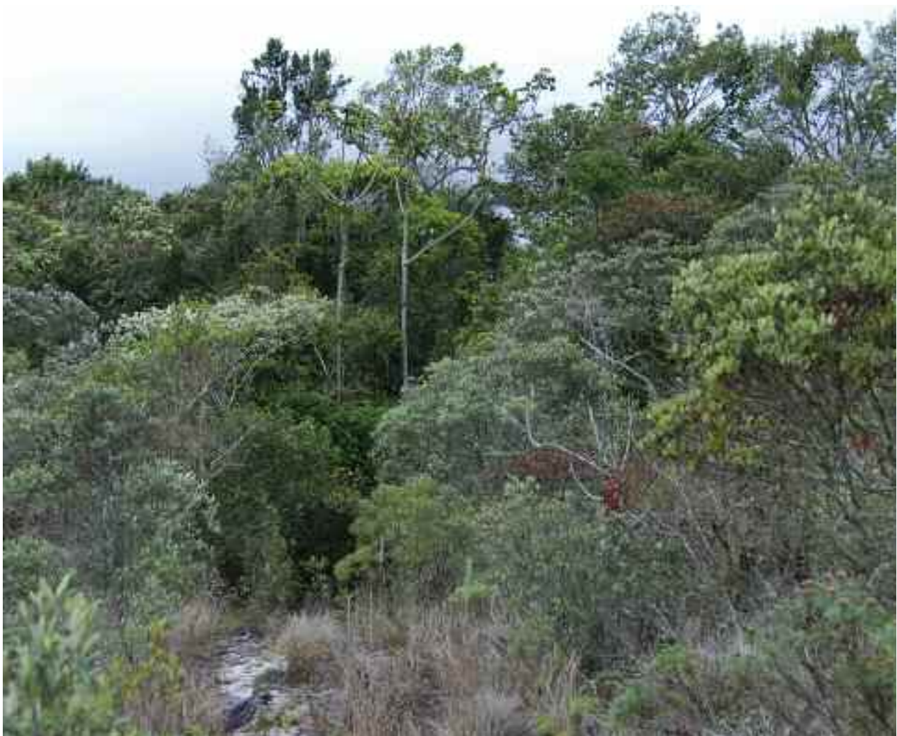
FIGURA 1 – Aspecto da paisagem do Parque Estadual do Ibitipoca, com destaque para a Mata Grande formada por Floresta Ombrófila Densa, uma das localidades de amostragem de morcegos.