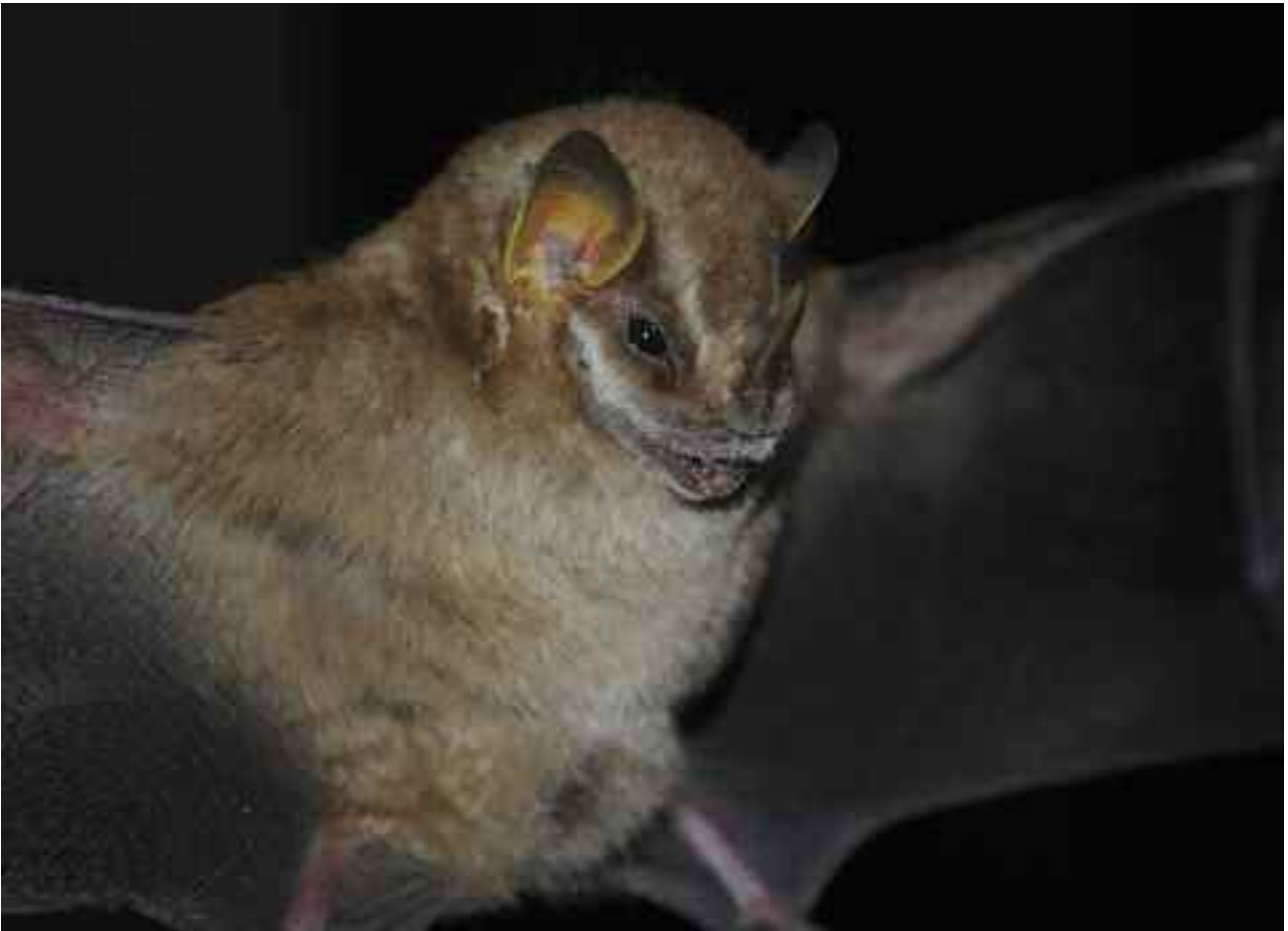
FIGURA 16 – Morcego frugívoro, Vampyressa pusilla (Wagner, 1843).

(SIMMONS, 2005) e a subfamília Myotinae está representada por seis espécies no Brasil (BIANCONI & PEDRO, 2007). São morcegos de pequeno porte, sem folha nasal, uropatágio bem desenvolvido e todas as espécies brasileiras possuem dieta insetívora. No Parque Estadual do Ibitipoca foram registradas três espécies de Myotis , todas associadas a ambientes florestais.