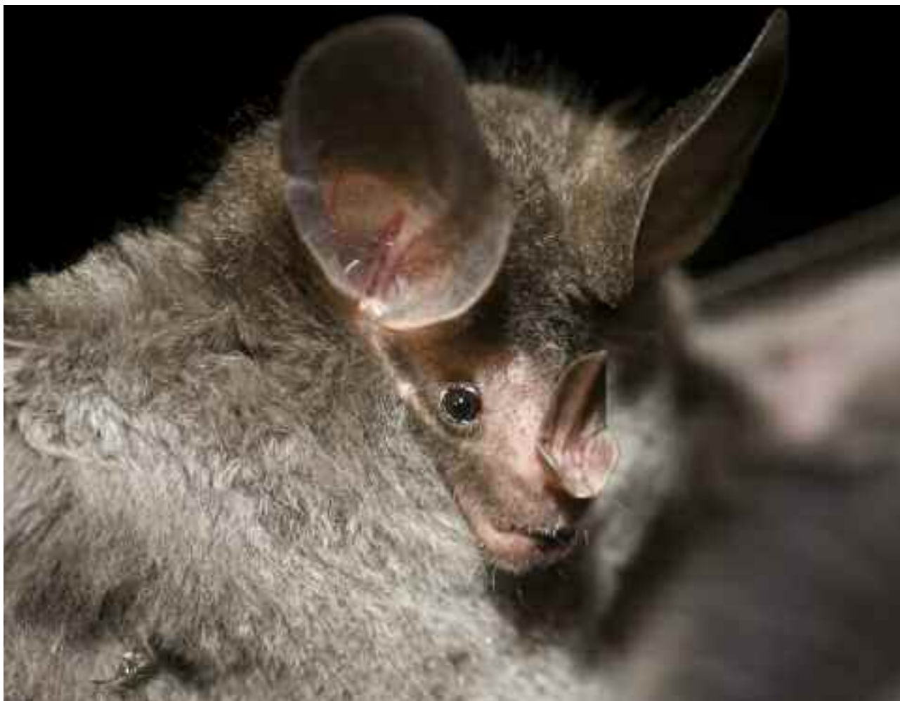
FIGURA 8 - Morcego carnívoro/frugívoro, Chrotopterus auritus (Peters, 1856).