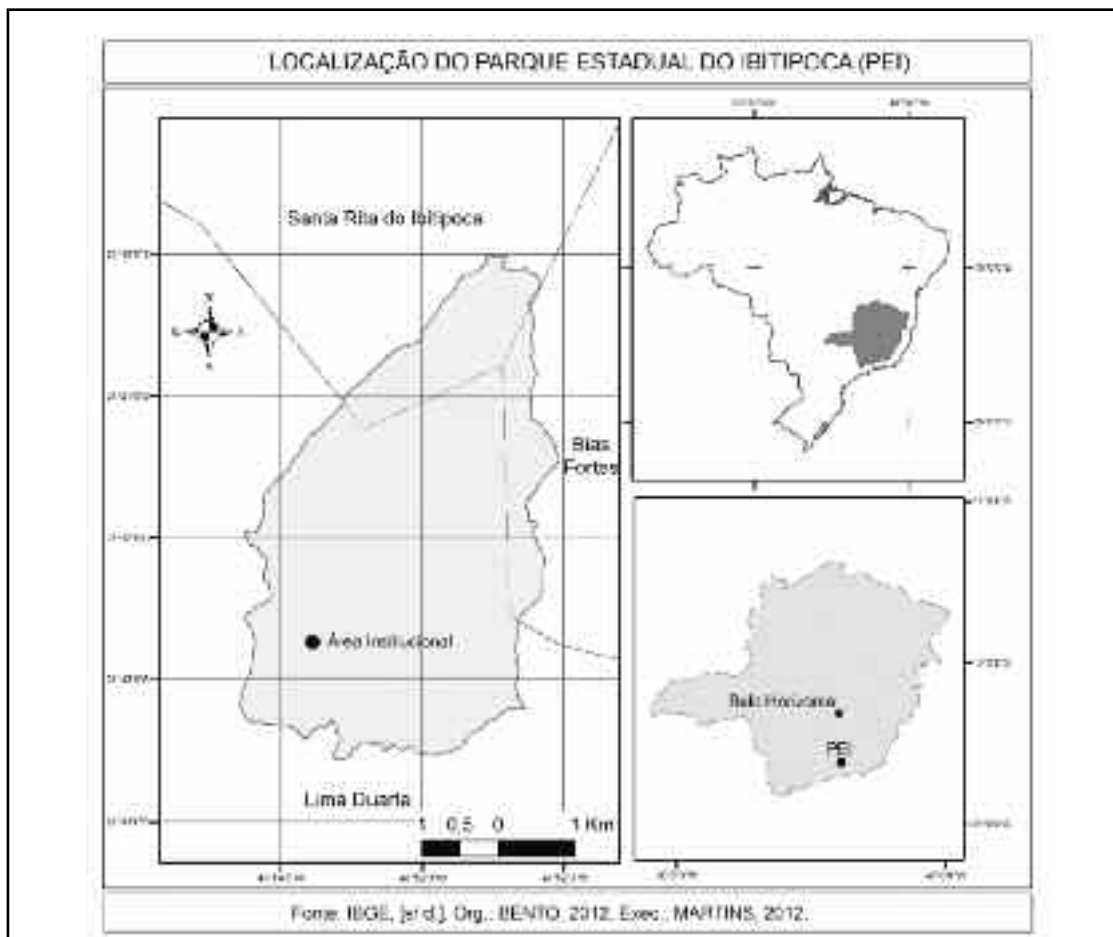
FIGURA 1 – Localização do Parque Estadual do Ibitipoca/MG.

área de estudo. Dentre os principais autores analisados, destacam-se Nummer (1991), Pinto (1991), Pacciulo e outros (1996), Corrêa Neto; Baptista Filho (1997), Zaidan (2002), Heilbron e outros (2003), Pacciulo; Trown; Ribeiro (2003), Silva (2004), Valeriano e outros (2004), Schaefer (2006), Rodela (2010) e Rocha (2011). b) Trabalhos de campo na área de estudo, os quais nesta etapa da pesquisa foram fundamentais para confrontar a fundamentação bibliográfica, bem como para realizar a documentação fotográfica a partir de uma câmara fotográfica Sony Steady Shot (DSC-W320).